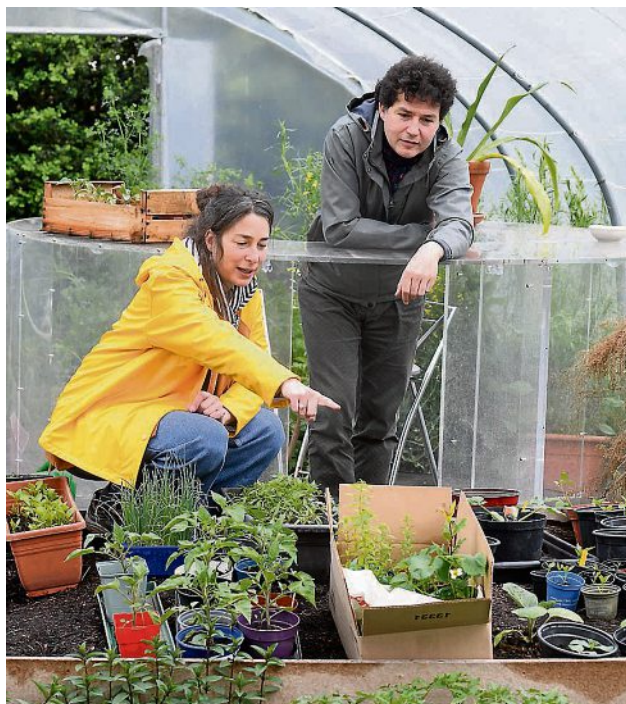
L'ASBL culturelle a concocté plein d'activités dans son jardin.

LUXEMBOURG À travers le pays, 32 jardins seront à découvrir ce week-end, dont celui de Canopée Produktion.