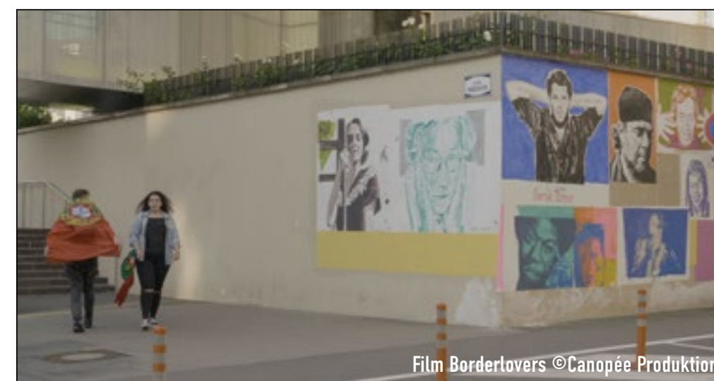
Film Borderlovers