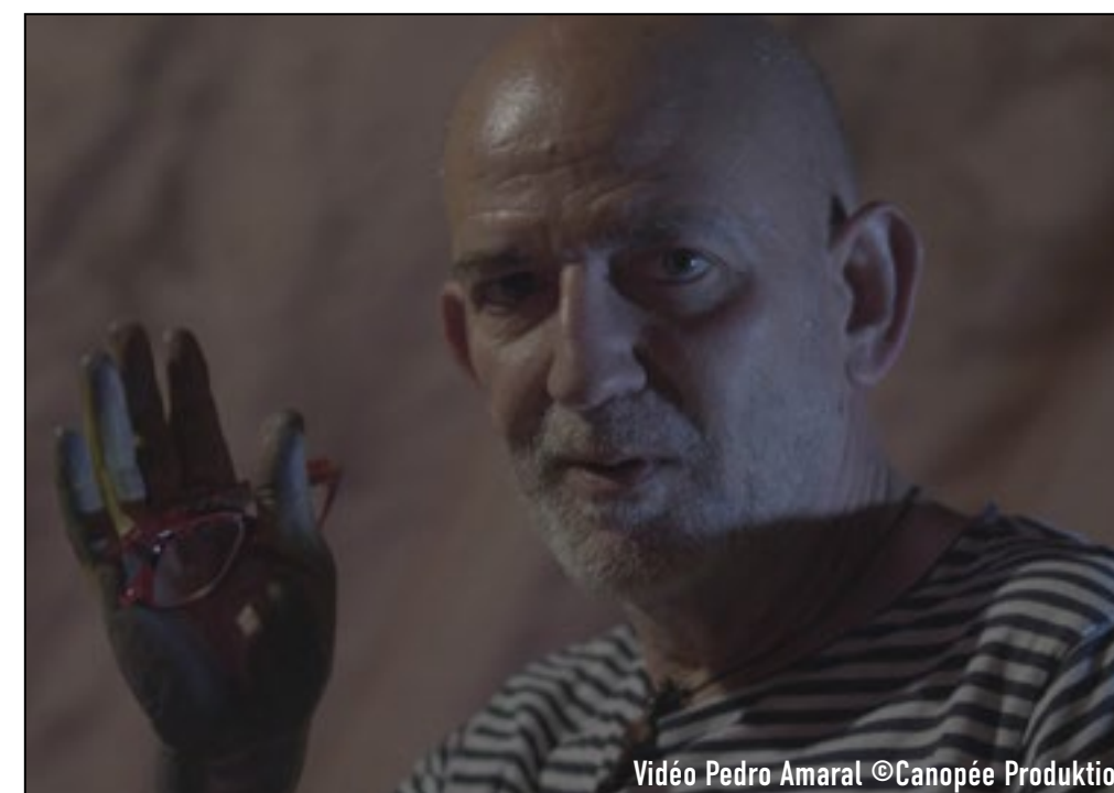
Vidéo Pedro Amaral ©Canopée Produktion