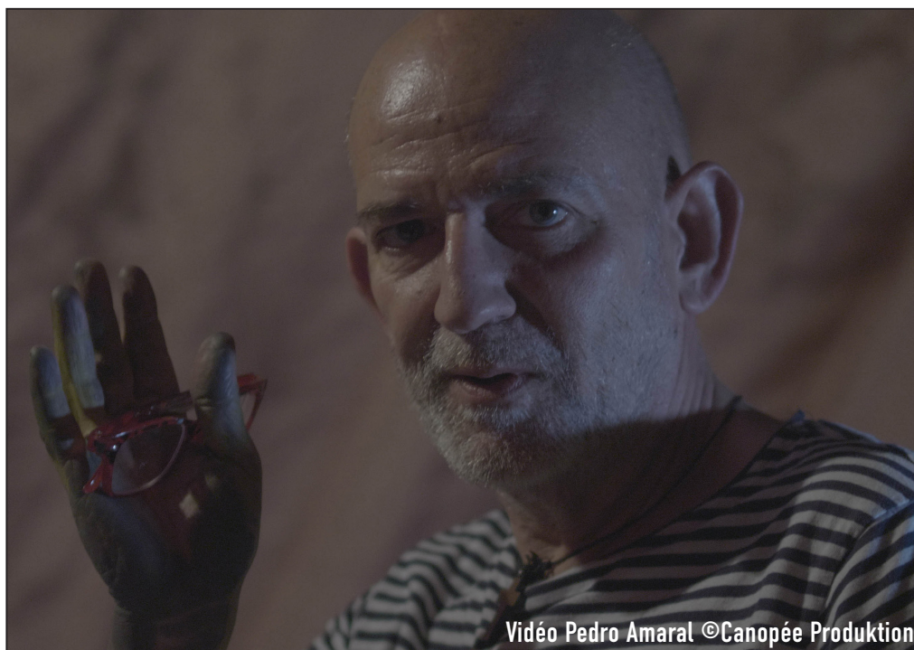
Vidéo Pedro Amaral ©Canopée Production