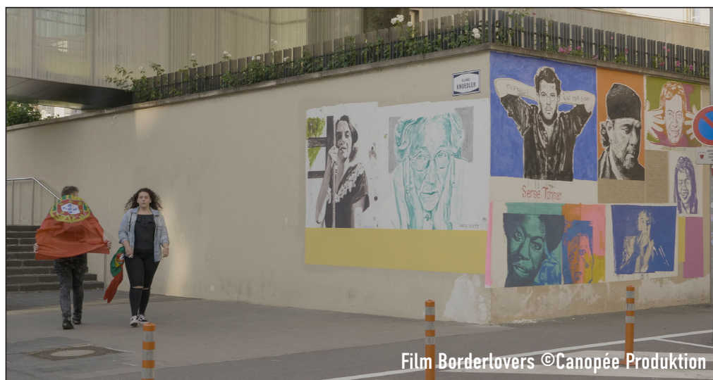
Film Borderlovers